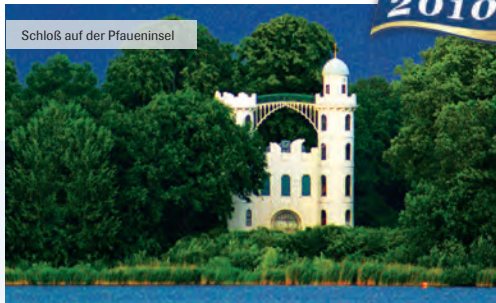
Schloß auf der Pfaueninsel