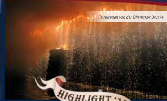
Feuerregen von der Glienicker Brücke